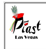
Piast (Las Vegas)