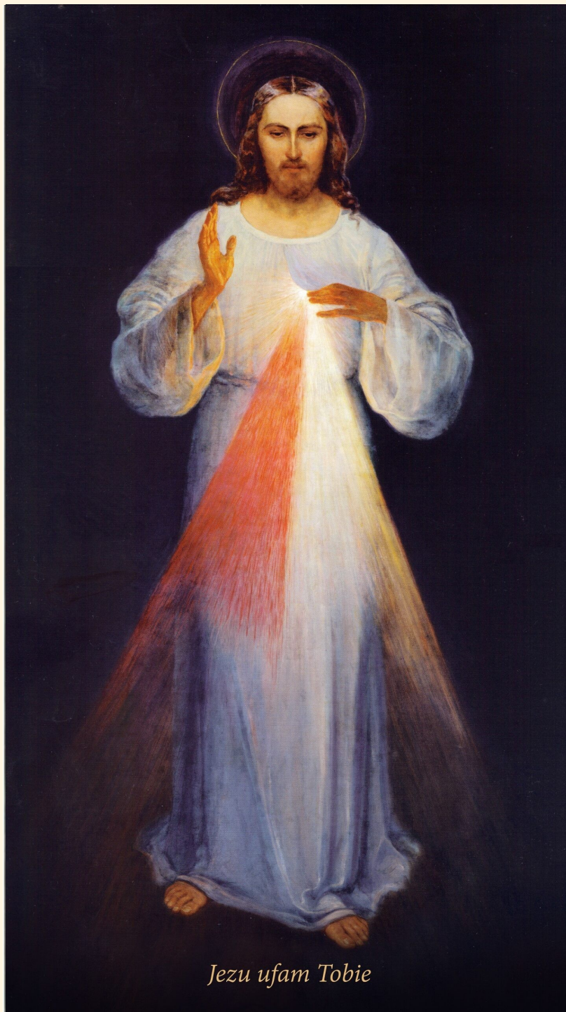
Jezu ufam Tobie