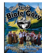
Bielo Gory (Phoenix)