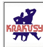
Krakusy (Los Angeles)