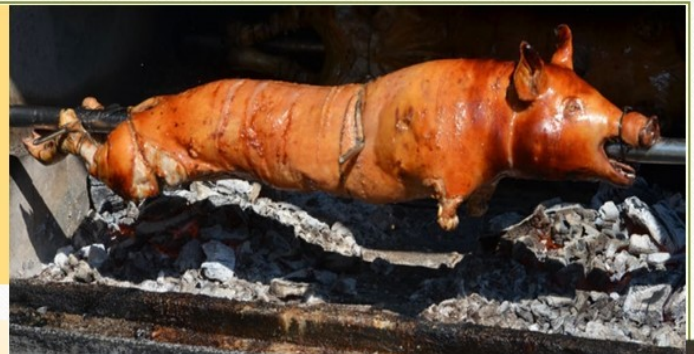
Cooking A Whole Pig