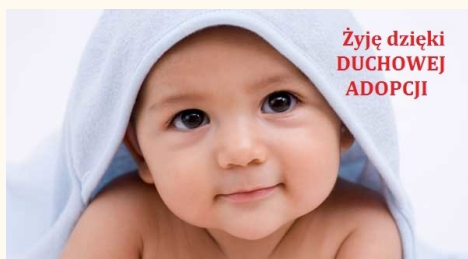
Żyję dzięki DUCHOWEJ ADOPCJI

Więcej informacji można znaleźć na www.duchowaadopcja.info